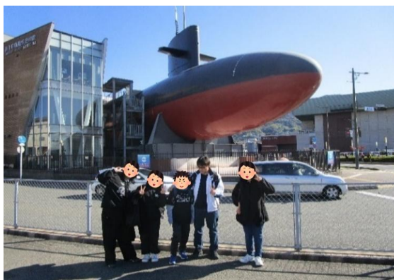
呉市てつのくじら館