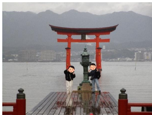
厳島神社の大鳥居